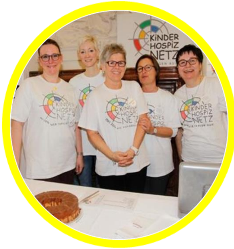
Karriere Messe Modeschule Hetzendorf