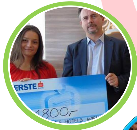
Sommerfest Fleming's Hotels