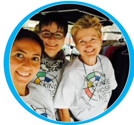
Flohmarkt Neubaugasse Fleming's Hotels